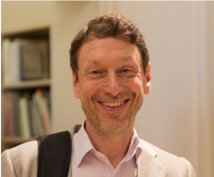
James Elkins, Stories of Art . Taylor and Francis, 2013