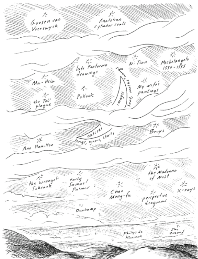
”The history of art imagined as a field of stars”. Tegning af James Elkins (3).